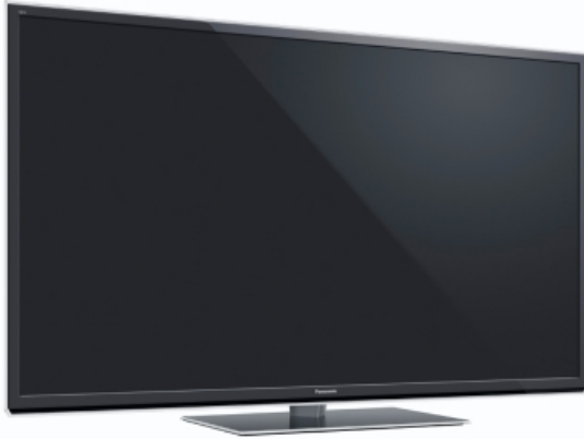
Panasonic TX-P 65 STW 50 65" Full HD 3D Progressive (aktiv) Plasma Fernseher