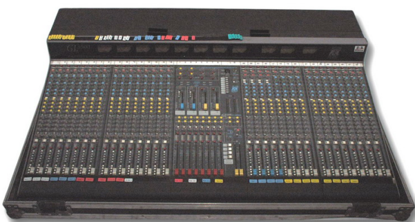
Allen & Heath GL 3300 28 Mono (Mic/Line) Inputs mit par. Mitten, 4 Stereo Line Inputs, 8 Subgr., 8 Aux, im Case