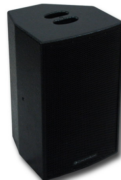
Concert Audio V10 Flexibel einsetzbarer Multifunktionslautsprecher 10"/1", 90° x 70°, Kombigehäuse für Monitor und Standardbetrieb