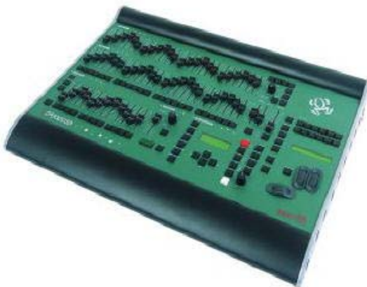
Zero88 Fat Frog 24/48 Kanal und 12 Movinglights Hybridkonsole DMX 512