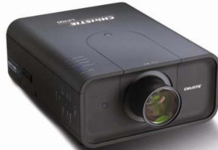
Christie LX700 Videobeamer 7.000 ANSI-Lumen, HDTV 1080i kompatibel, Lensshift (motorisiert), Zoom (motorisiert)