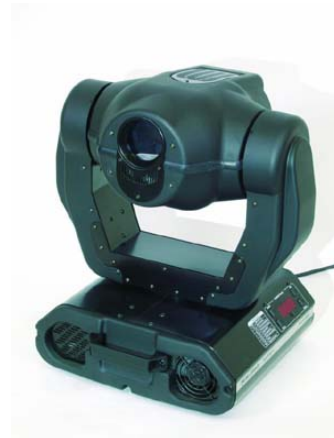
Futurelight MH 660 DMX 512 Moving Head mit MSD 250 Leuchtmittel, inkl. Fluggeschirr